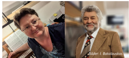
Bilder: I. Batalauskas

Unter dem Motto „Von Barock bis zur Gegenwart“ laden wir Sie zu einem Abend mit Orgel- und Vokalmusik ein. Erleben Sie einen stimmungsvollen Konzertabend mit Werken großer Meister – von der prachtvollen Barockzeit bis hin zur Musik unserer Tage. Auf dem Programm stehen Kompositionen von Pachelbel, Händel, Bach, Beethoven, Rheinberger, Franck und Jones. Die Auswahl verspricht ein abwechslungsreiches musikalisches Erlebnis voller Ausdruckskraft und Tiefe. Lassen Sie sich von den vielfältigen Klangfarben der Orgel verzaubern und genießen Sie die eindrucksvolle Verbindung von Instrumental- und Vokalmusik. Ein Abend voller Emotionen, musikalischer Meisterwerke und festlicher Atmosphäre erwartet Sie.