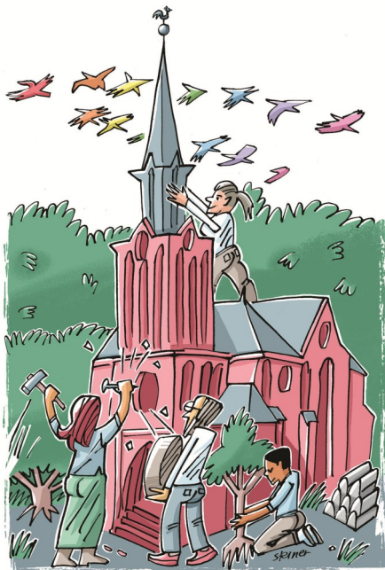
Grafik: Elke Steiner / steinercomix.de

Spendeneingänge für die allgemeine Gemeindegarbeit oder ohne Verwen-