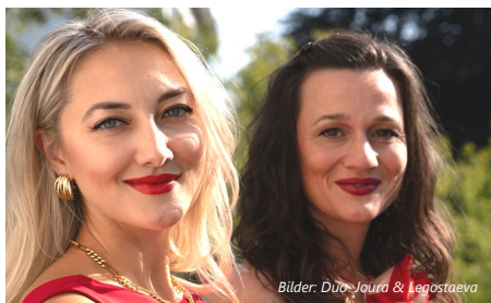
Bilder: Duo Joura & Legostaeva